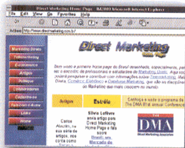
Página de abertura da home page directmarketing

Algumas empresas de Marketing e consultorias de Recursos Humanos já cadastradas poderão fazer a busca de candidatos de uma forma muito interativa, como por exemplo por área de interesse ou formação acadêmica. Além disso, receberão, mensalmente, o currículo completo dos candidatos via e-mail.